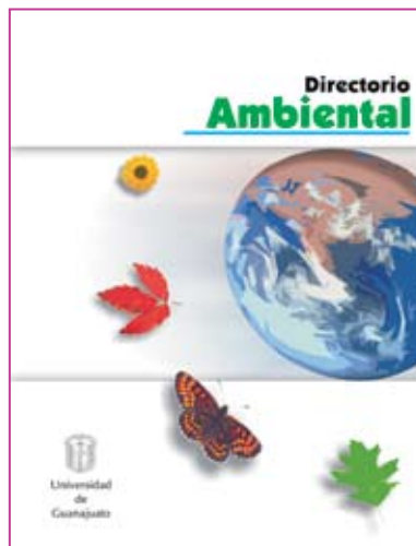
Portada del Directorio Ambiental de la UG

6. El Directorio Ambiental , documento que contiene la información más relevante y actualizada de los profesores de la Universidad de Guanajuato, que están involucrados o desean participar en actividades relacionadas con la temática ambiental. Uno de los objetivos del Directorio Ambiental es propiciar la elaboración de proyectos educativos, de investigación o de extensión, con la participación de profesores y estudiantes de diversas Unidades Académicas de la UG, que contribuyan a la solución de la problemática ambiental a través de la formación de grupos multidisciplinarios.