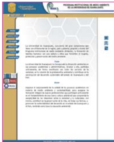
Página Web del PIMAUG

3. La Página Web ( www.ugto.mx/pimaug ), en la cual se puede encontrar información actualizada propia del PIMAUG, como sus objetivos, metas, líneas estratégicas y proyectos principales, así como información referente a la colaboración con dependencias Estatales y Federales encargadas de la Gestión Ambiental, y una agenda sobre diplomados, cursos, talleres, congresos, seminarios, etc.